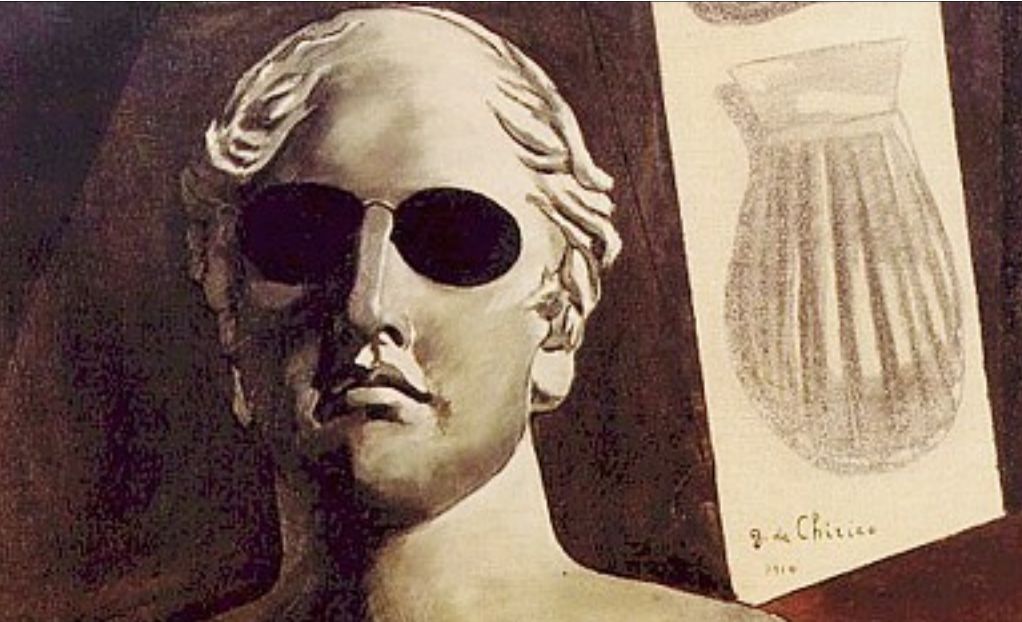
APPRENDRE À REGARDER. L'approche d'un tableau est multiple. (Vue partielle du Portrait prémonitoire de Guillaume Apollinaire, par Giorgio De Chirico, 1914), Collection Musée National d'Art Moderne, Centre Georges-Pompidou, Paris.

Des éditeurs proposent, dans cette optique et avec plus ou moins de bonheur, des ouvrages d'initiation destinés aux enfants. L'écrivain et réalisateur Alain Jaubert, ancien enseignant et ex-journaliste (« Palettes », série de films cultes consacrés à la lecture des tableaux diffusée sur Arte), avec un conservateur de musée (Valérie Lagier,