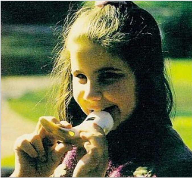
AVEC LA PETITE CABRETTE. De quoi découvrir beaucoup de sonorités.