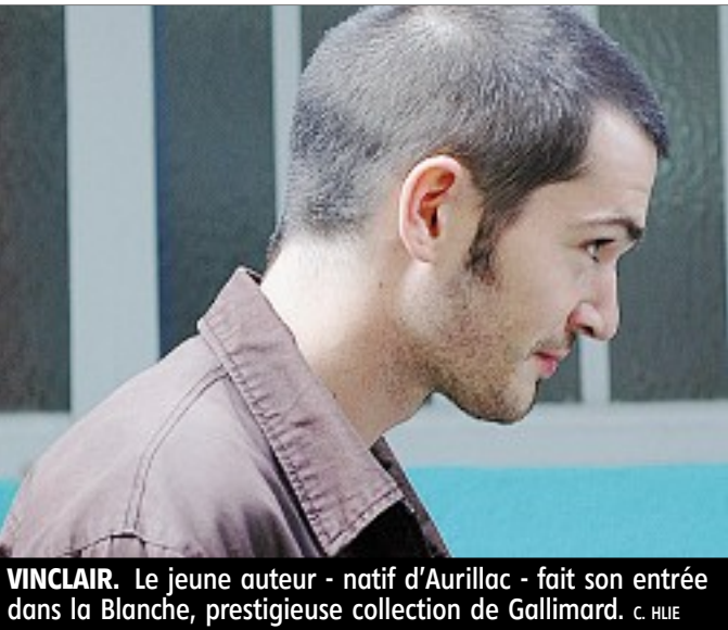
VINCLAIR. Le jeune auteur - natif d'Aurillac - fait son entrée dans la Blanche, prestigieuse collection de Gallimard. C. HUIE

L'intérêt de ce premier roman tient à la liberté de ton, dans la phrase et la composition. Comme à la façon de redonner du souffle à un thème maintes fois traité, celui de la paternité. Elle apparaît ici aussi réelle que fictive, génétique qu'intellectuelle.